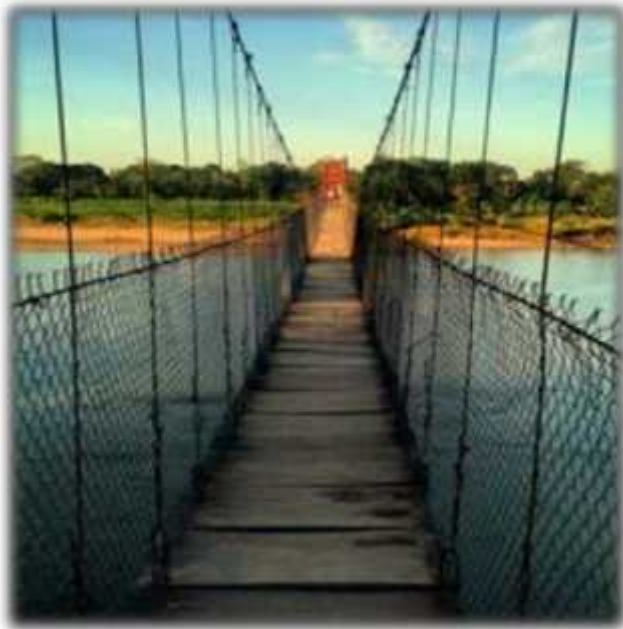
Puente La Candelaria