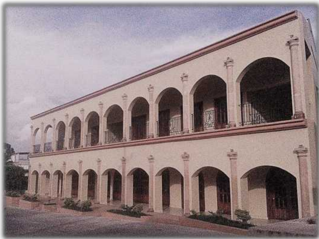
Casa de Cultura