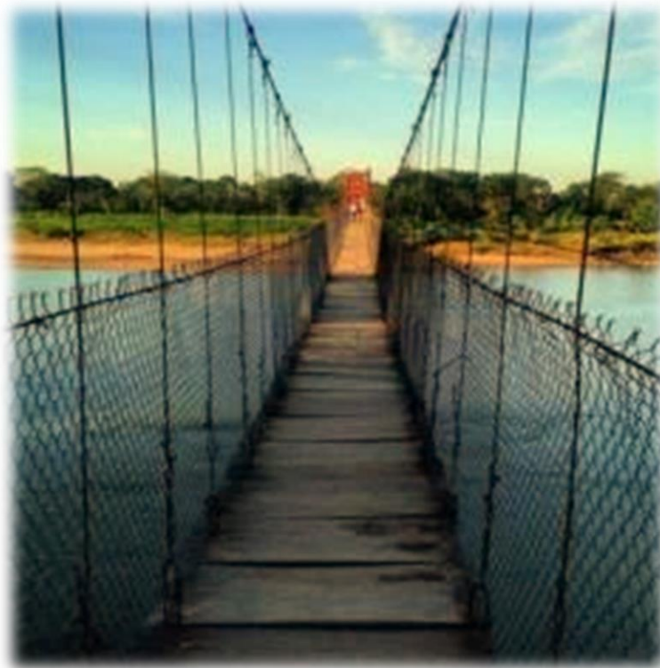
Puente La Candelaria