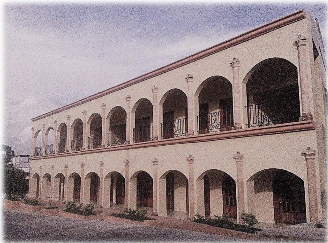
Casa de Cultura